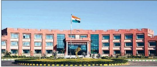
महेंद्रगढ़। हरियाणा केंद्रीय विश्वविद्यालय का भवन।